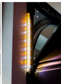
Ruban d'éclairage Lumi/Avertisseur lumineux