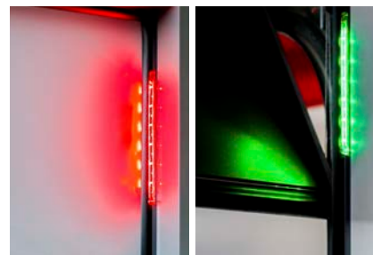
Feu à ruban d'éclairage Lumi

Édition : 04/2018. Sous réserve de défauts d'impression, d'erreurs et de modification technique.