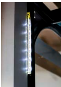
Ruban d'éclairage Lumi

Feu à ruban d'éclairage Lumi, 6 LED vertes/6 LED rouges, puissance : 9 watts